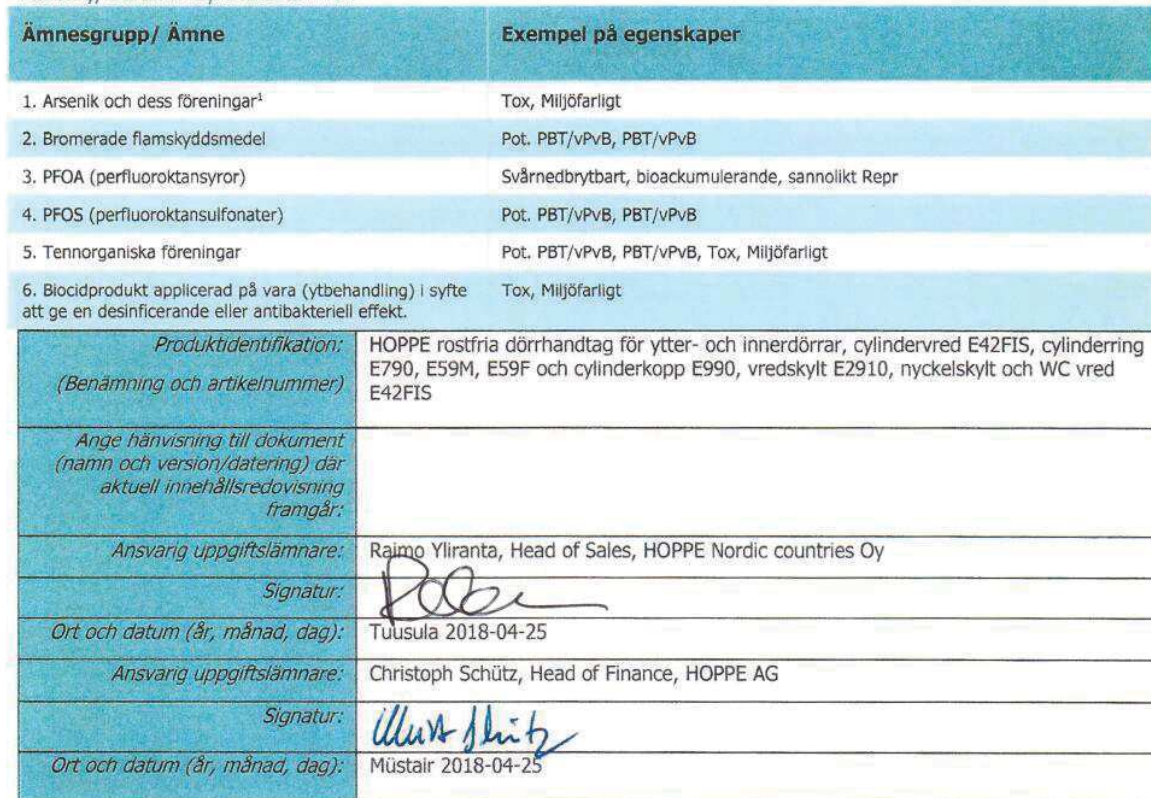
Tabell 4, Särskilt utpekade ämnen